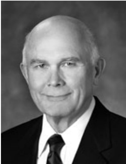
ELDER JEFFREY R. HOLLAND