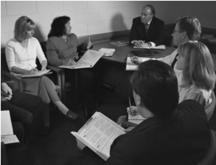
Kapag may miting ang ward council o presidency, dapat nilang isaisip, "Paano natin masusuportahan ang pamilya?"

Kung mas maraming oras para sa pamilya, lalong may responsibilidad ang mga magulang na tiyaking hindi lang iyon dagdag na panood ng telebisyon, pagsali sa mga palaro, o partisipasyon sa maraming iba pang mabubuting aktibidad sa komunidad para sa mga bata. Hindi natin ipinakilipagkompetensya ang Simbahan sa iba pang mga aktibidad. Sinisikap nating limitahan ang mga miting at aktibidad ng Simbahan para mas may oras para sa pamilya. At sa pamilya dapat iukol ang oras na iyon at hindi sa iba pang bagay.