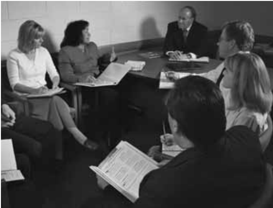
Тойргийн зөвлөл буюу ерөнхийлөгчийн зөвлөл хуралдахдаа “Бид гэр бүлийг хэрхэн дэмжиж чадах вэ?” хэмээн бодож үзэх хэрэгтэй.

боломжийг бидэнд олгоно гэдэгт бид найддаг.