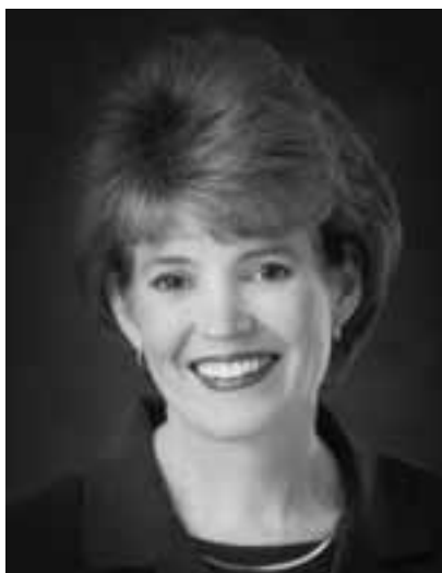
СЮЗАН В.ТАННЕР ЗАЛУУ ЭМЭГТЭЙЧҮҮ- ДИЙН ЕРӨНХИЙ ЕРӨНХИЙЛӨГЧ