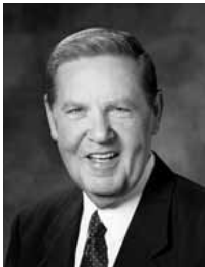
АХЛАГЧ ЖЭФФРИ Р.ХОЛЛАНД АРВАНХОЁР ТӨЛӨӨЛӨГЧИЙН ЧУУЛГЫН