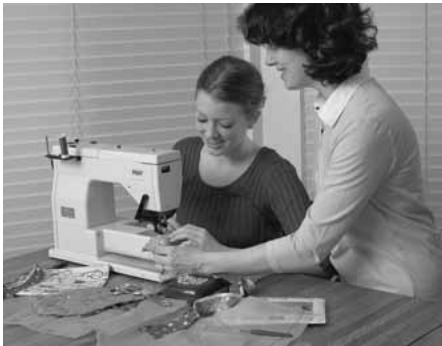
Загвар нь Бурханаас ирдгийг бид бүгд хүлээн зөвшөөрч, үүний төлөө чадах бүхнээ хийхийг хичээх учиртай.

Бид гэрлэлт, гэр бүлийн тухай ярихдаа яагаад төгс загварын тухай ярьдгийг ойлгоход энэ нь та нарт тусална гэдэгт би найдаж байна.