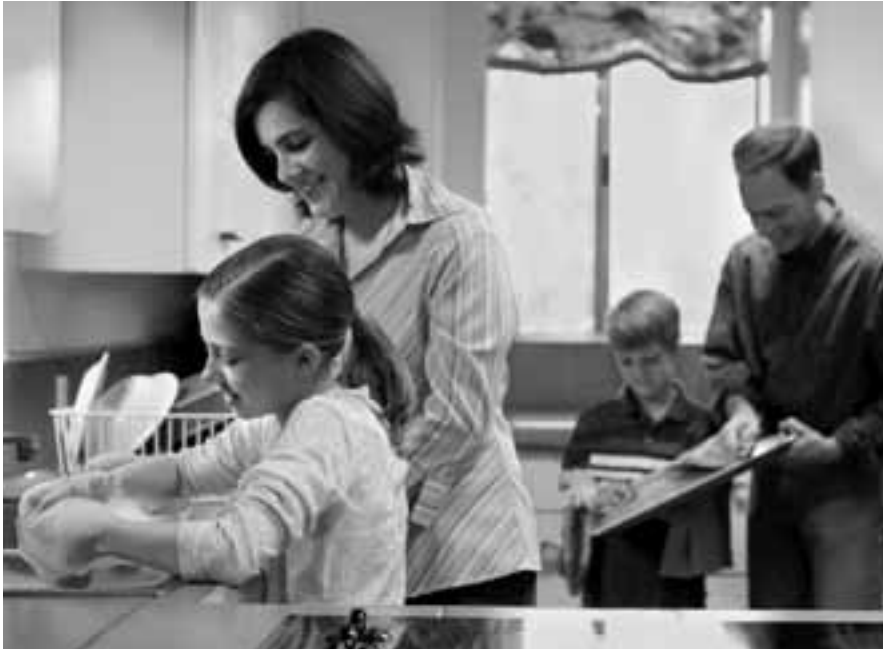
Ариун үүргээ биелүүлэхэд эцэг эхчүүд харилцан бие биедээ адил тэгш туслах ёстой.

харин гэр бүл болох үлэмж сайн үндэс суурь юм.