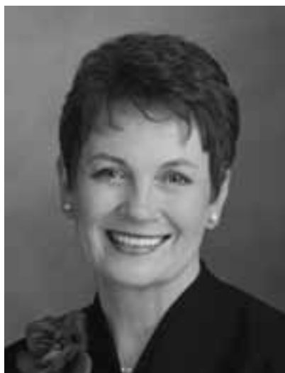
ШЕРИЛ С.ЛАНТ ХҮҮХДИЙН ХЭСГИЙН ЕРӨНХИЙ ЕРӨНХИЙЛӨГЧ