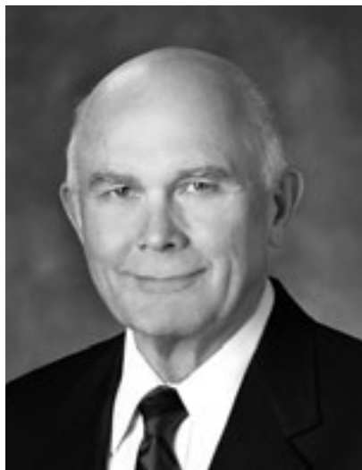
ÆLDSTE JEFFREY R. HOLLAND