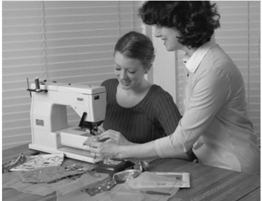
Mahimo kitang magkauyon sa sundanan ingon sa kini moabot gikan sa Dios, ug kita makapaningkamot nga kini matinuod kutob sa atong mahimo.

Karon, hinaut nakatabang kini kaninyo nga masabtan nganong naghigut kita kabahin sa pattern, ang sulundon, sa kaminyoon ug pamilya nga nasayud man kita nga dili tanan karon nagpuyo nianang sulundon nga