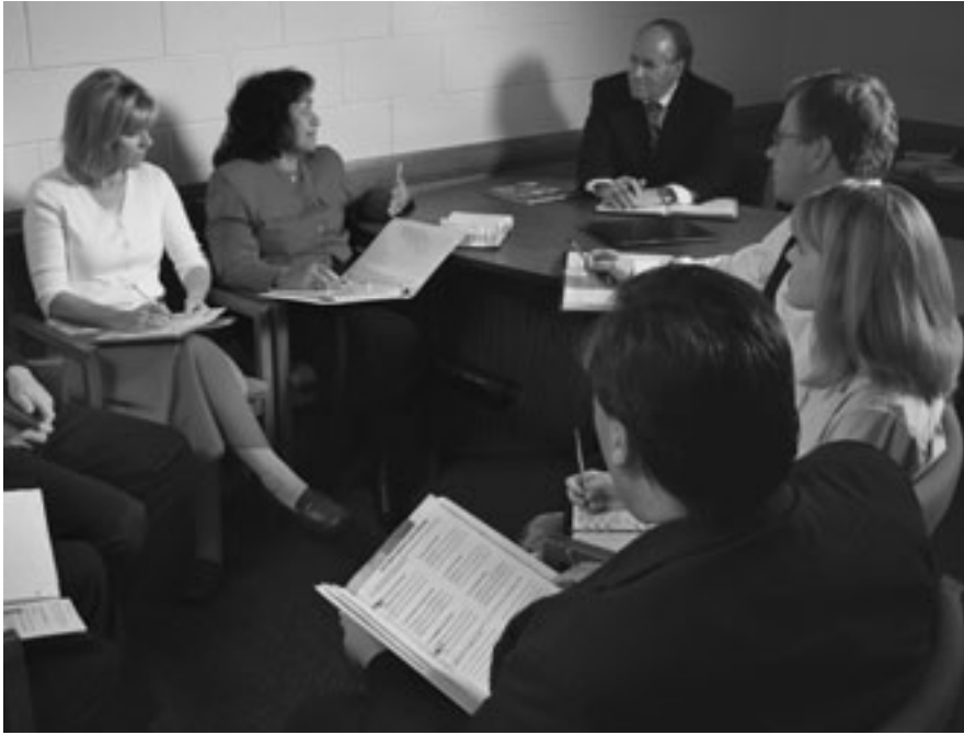
Kon ang usa ka ward council o presidency magtigum, sila kinahanglan mokonsiderar, “Unsaon namo pagsuporta ang pamilya?”

sa telebisyon, indibidwal nga mga kalihokan sa paugnat sa kusog, o partisipasyon sa daghan, maayo kaayo nga mga kalihokan sa komunidad alang sa kabataan. Wala kita mohimo sa simbahan nga makigtakos sa ubang mga kalihokan. Atong gipaningkamotan ang pagdisiplina sa paggamit sa mga miting sa Simbahan ug mga kalihokan sa Simbahan nga pabor sa pamilya. Ug ang pamilya kinahanglang mogamit nianang dugang nga oras imbis dapi-ton ang uban nga mogamit niini.