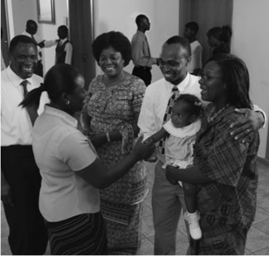
Dili sayon ang pag-establisar og pamilya niining kinabuhia ug sa pagpadako og mga anak. Apan sa Simbahan inyong makit-an ang panabang nga inyong gikinahanglan.