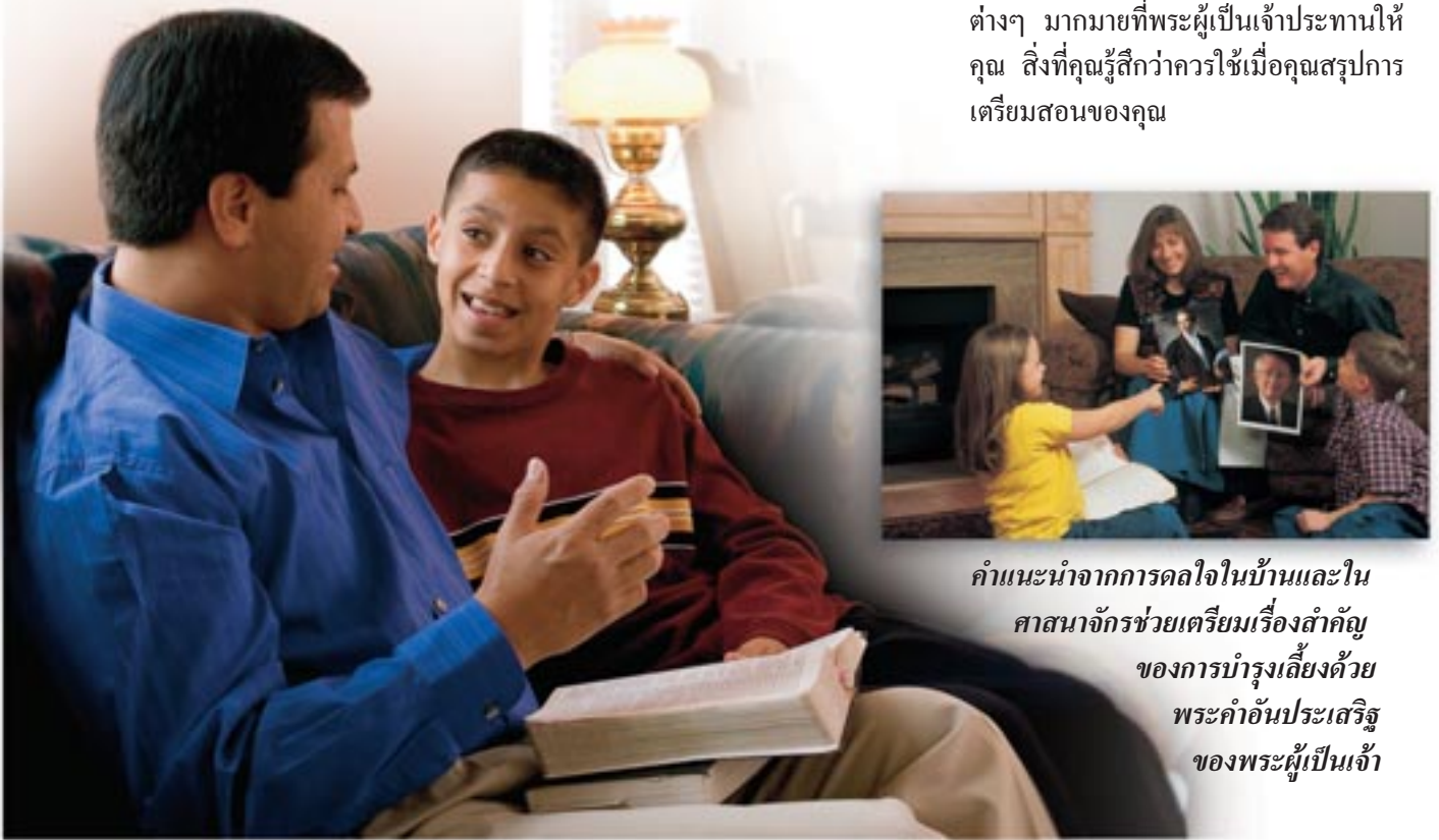
คำแนะนำจากการดลใจในบ้านและใน ศาสนาจักรช่วยเตรียมเรื่องสำคัญ ของการบำรุงเลี้ยงด้วย พระคำอันประเสริฐ ของพระผู้เป็นเจ้า

ตัวอย่างเช่น ถ้าผมจะสอนชั้นเรียนในวันอาทิตย์ ผมจะอ่านบทเรียนทั้งหมดและเริ่มสวดอ้อนวอนล่วงหน้าหนึ่งอาทิตย์ ซึ่งทำให้ผมมีเวลาสวดอ้อนวอนทั้งสัปดาห์เพื่อแสวงหาการดลใจ คิด อ่าน และสังเกตการประยุกต์ใช้ในชีวิตจริงที่จะทำให้ข่าวสารของผมมีชีวิตชีวา คุณจะไม่ได้ข้อสรุปสำหรับบทเรียนได้เร็วขนาดนั้นแต่คุณจะแปลกใจว่ามีสิ่งต่างๆ มากมายเกิดขึ้นกับคุณในระหว่างสัปดาห์ สิ่งต่างๆ มากมายที่พระผู้เป็นเจ้าประทานให้คุณ สิ่งที่คุณรู้สึกว่าคุณใช้เมื่อคุณสรุปการเตรียมสอนของคุณ