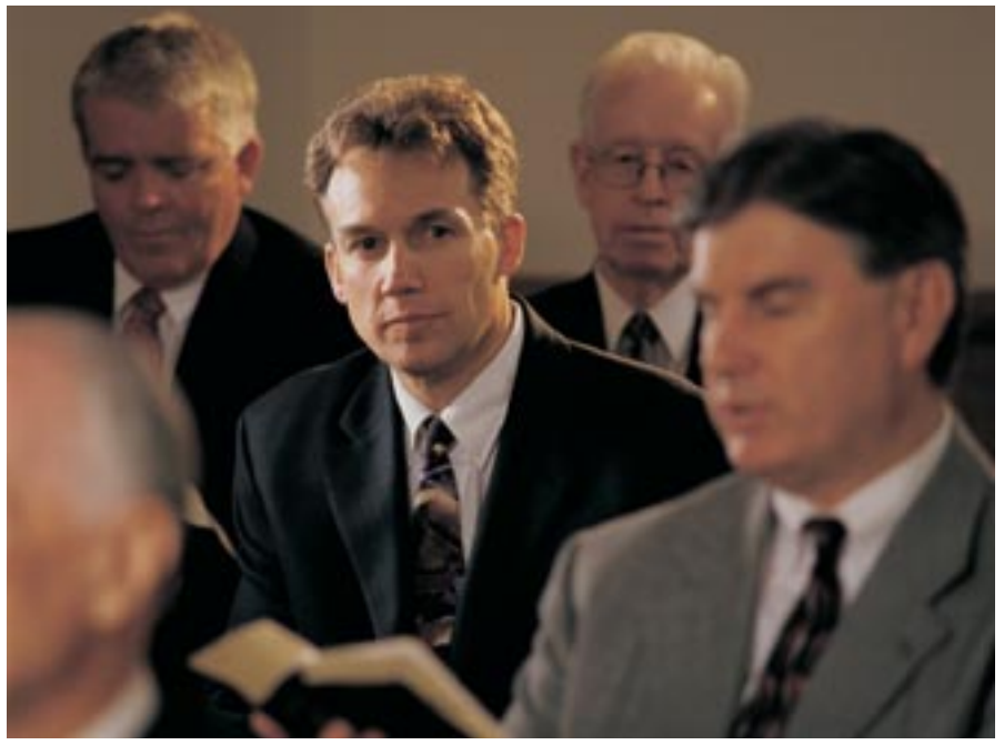
ภาพ: ภาพถ่ายโดยมิทธีว โรเจอร์ ใช้ผู้แสดงแบบ

เอ็ดเดอร์ ฮอลแลนด์: นั่นเป็นประเด็นที่ดี คุณจะอย่างไรถ้ามันเป็นสิ่งที่คุณ